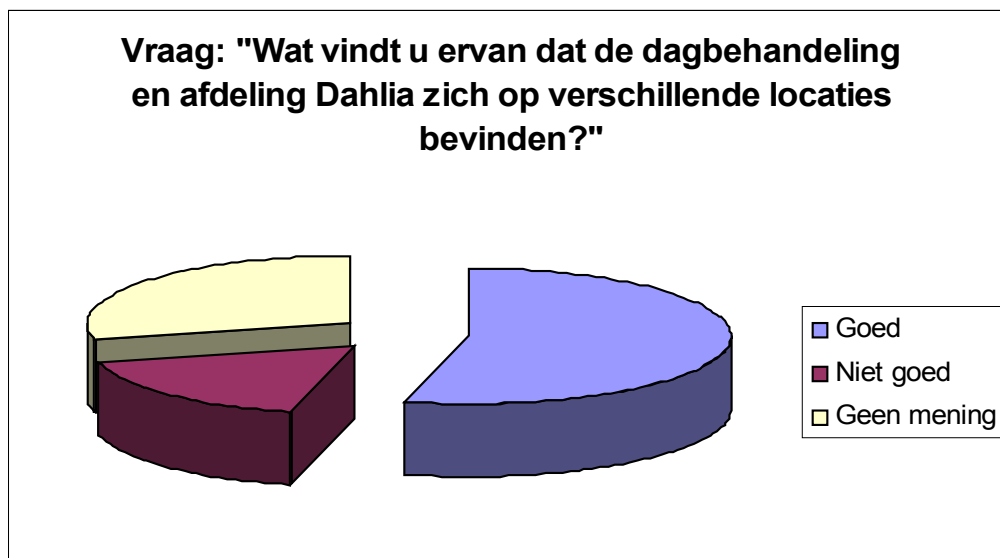
Figuur 1. Mening respondenten over verschillende locaties dagbehandeling en afdeling Dahlia

Bijna een derde van de respondenten had hierover geen mening (29%), iets meer dan de helft van de respondenten (54%) vond het 'goed' en een klein aantal respondenten (17%) vond het 'niet goed' (zie figuur 1).