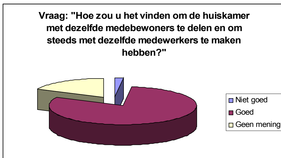
Figuur 2. Belang dat respondenten hechten aan een constante woonomgeving

Samengevat werden bovenstaande vragen in 81% van de gevallen positief beantwoord, in 18% van de gevallen neutraal beantwoord en in 2% van de gevallen negatief beantwoord (zie figuur 2). Deze resultaten geven aan dat respondenten veel belang hechten aan een constante woonomgeving.