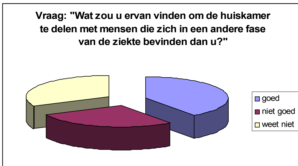
Figuur 3. Mening van respondenten over niet-gedifferentieerde huiskamers

Ruim één derde van de respondenten (40%) reageerden met 'goed' als antwoord op deze vraag, één derde (32%) reageerde neutraal en iets minder dan één derde (28%) reageerde met 'niet goed' als antwoord op deze vraag (zie figuur 3). Positieve reacties waren bijvoorbeeld: "De stabiliteit van de groep en de woonplek is belangrijker" en "Het stimuleert de minder zieke mensen om de ziekere mensen te helpen en de ziekere mensen kunnen zich aan de minder zieke mensen optrekken". Negatieve reacties waren vooral: "Het is voor mensen in de eerste fase confronterend om mensen in de laatste fase van de ziekte te zien".